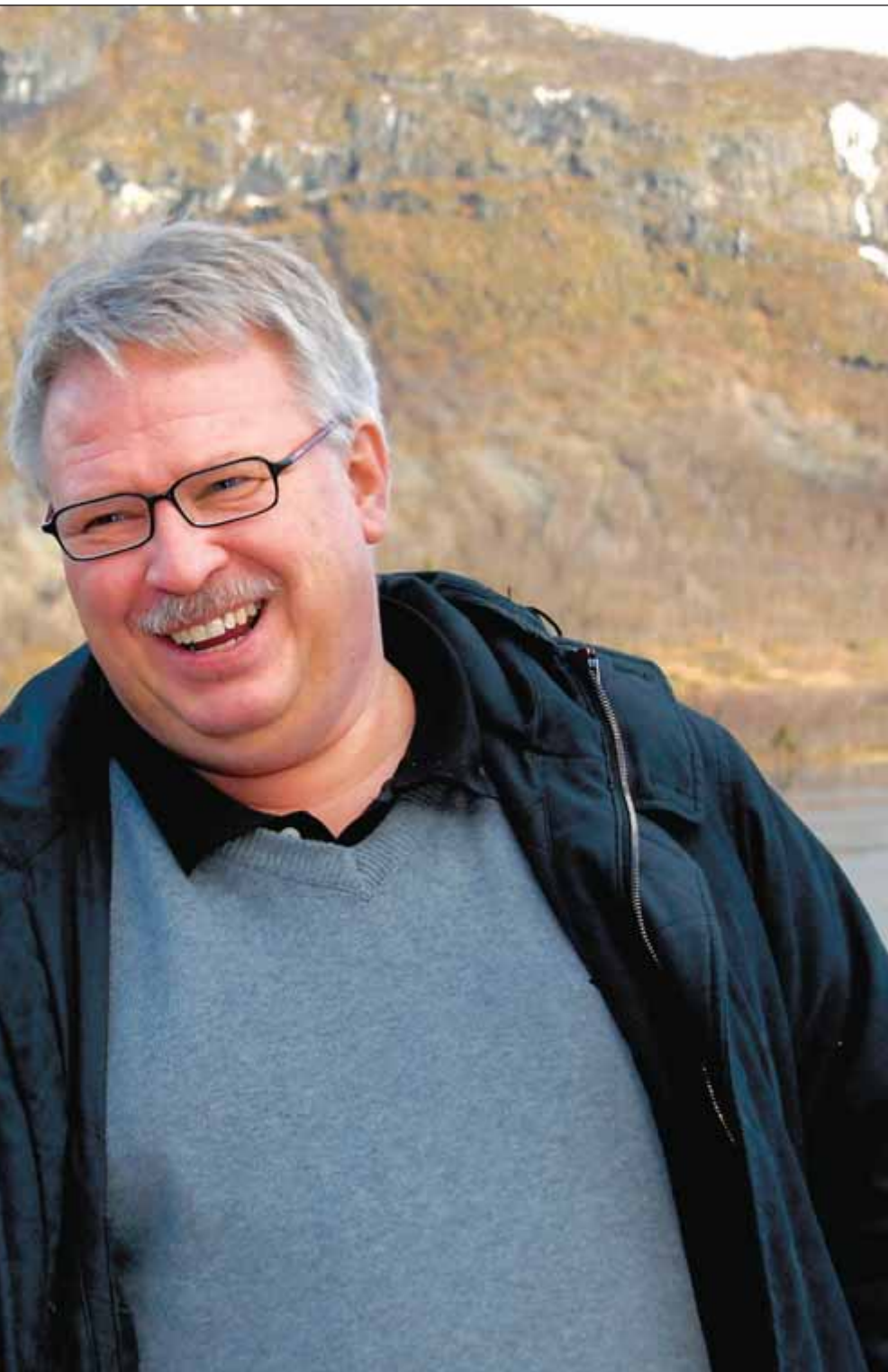
delar av boka har han skrive på hytta i Hemsedal. Temaet er noko som mange kan kjenne han levde? Døden symboliserer det totale fråværet. Og me sit att med spørsmåla.

– Det skal vel litt til å ikkje dikte inn noko om eige liv. Men hugs, Kristian er ikkje meg, smiler han. Han starta å skrive boka som noko personleg. Noko heilt frå hjartet. Så distanserte han seg og let romanskapningane leve meir egne liv.